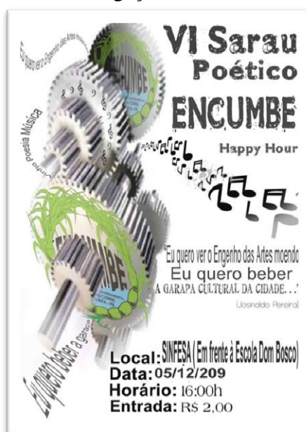
Figura 1: Folder de divulgação do VI Sarau Poético Encumbe

Enquanto sócio fundador permanecemos na Encumbe até a sua extinção. A documentação produzida e ou recebida no âmbito de suas atividades, ficaram sob minha responsabilidade, tornando-me curador deste fundo documental, o qual produziu uma considerável massa documental que foi tratada e devidamente organizada. A documentação a seguir demonstra alguns eventos e movimentos, alavancados pela Encumbe, ao longo de sua jornada . O folder ( figura 1 ) é fruto da divulgação do VI Sarau Poético Encumbe, realizado em 2009, no Sindicato dos Funcionários Públicos do Município de Santa Rita (SINFESA).