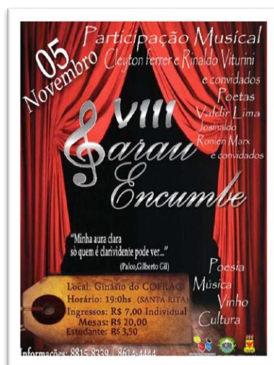
Figura 2: Folder de divulgação do VIII Sarau Encumbe